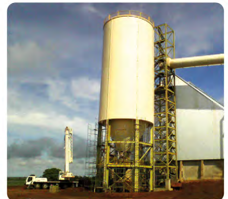
Silo de açúcar 1.200 ton