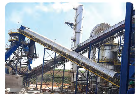
Sistema de transporte de bagaço