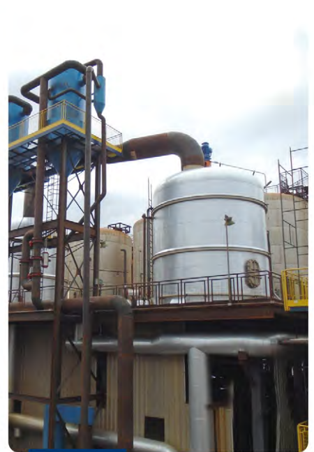
Cozedor batelada vertical 600 HL