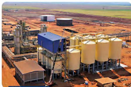
Pré-fermentação e fermentação completa

Conta com uma equipe técnica altamente capacitada e com “know how” para projetar (projetos próprios ou de terceiros); fabricar e comissionar visando máximo em eficiência operacional, segurança e HSE (saúde, segurança e meio ambiente).