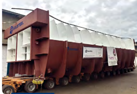
Tacho contínuo 3.000 HL (Tecnologia Fives Cail)