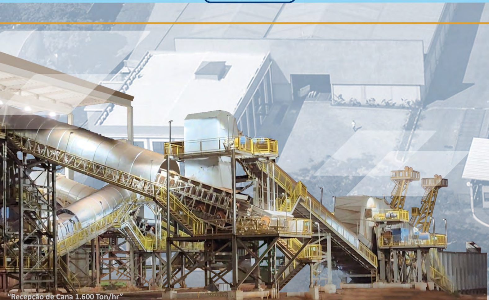
“Recepção de Cana 1.600 Ton/hr”