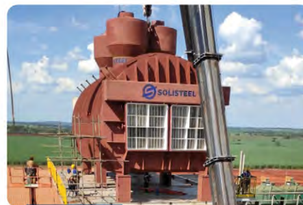
Tacho contínuo 3.000 HL (Tecnologia Fives Cail)