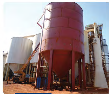
Dorna volante 800 m 3