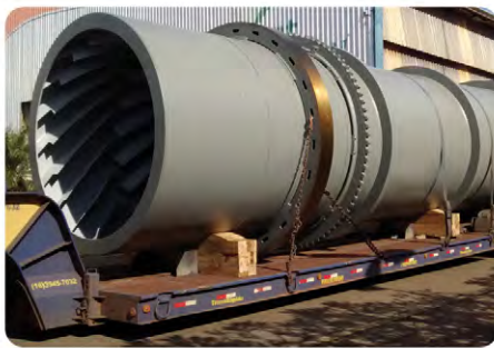
Secador de açúcar