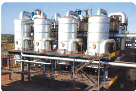
Sistema de concentração de caldo