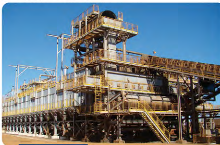
Difusor capacidade 12.000 TCD