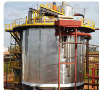
Decantador semirrápido 1.000 m 3