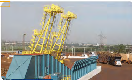
Recepção de cana picada