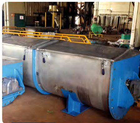
Transportador helicoidal para açúcar