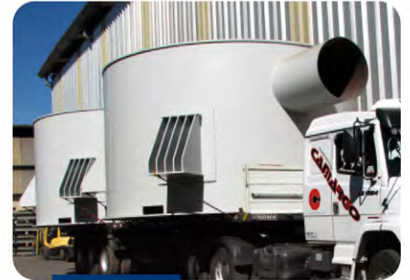
Evaporador tipo robert 2.000 m 2