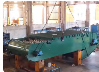
Esteira de arraste entre moendas 110"