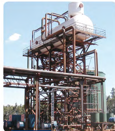
Desaerador térmico capacidade 300 m 3 /h