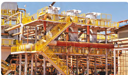
Sistema de aquecimento