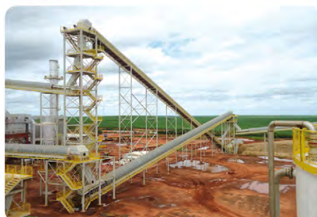
Circuito de transporte de bagaço