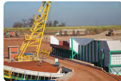
Recepção de cana picada