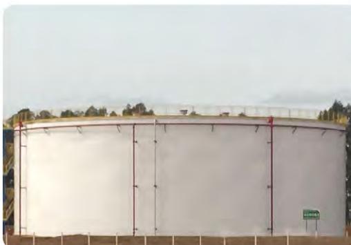
Tanque para armazenagem de etanol 20.000m 3