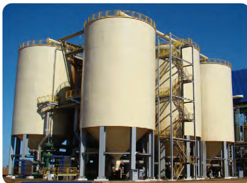
Sistema de fermentação