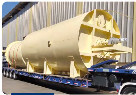
Cristalizador horizontal 1.000 HL