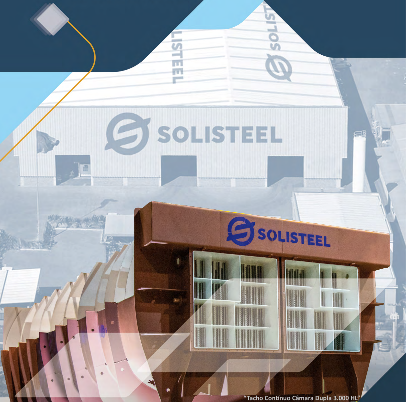
"Tacho Contínuo Câmara Dupla 3.000 HL"