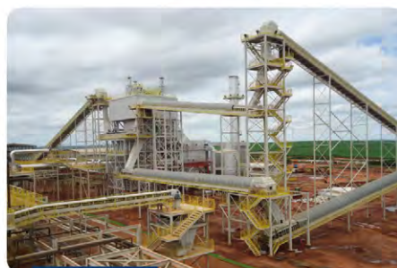
Circuito de transporte de bagaço