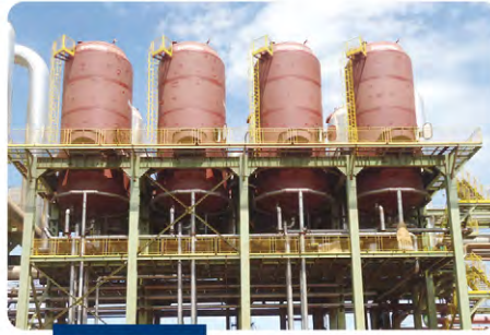
Sistema de evaporação tipo robert 1.800 m 2