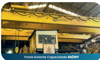
Ponte Rolante Capacidade 60/20T