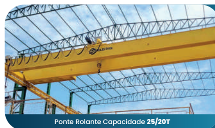
Ponte Rolante Capacidade 25/20T