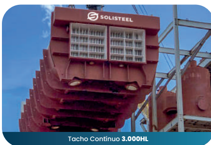
Tacho Contínuo 3.000HL