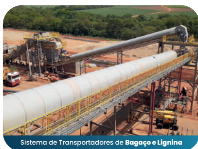
Sistema de Transportadores de Bagaço e Lignina