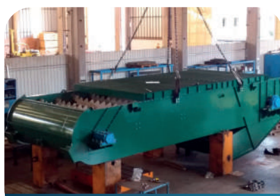
Esteira de Arraste Entre Moendas 110"