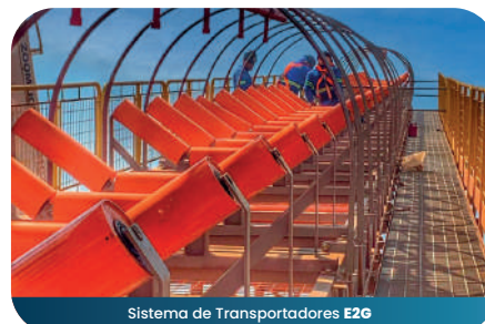
Sistema de Transportadores E2G