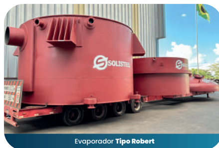
Evaporador Tipo Robert