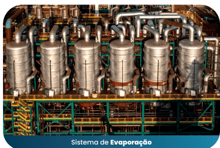
Sistema de Evaporação