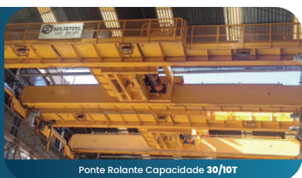
Ponte Rolante Capacidade 30/10T