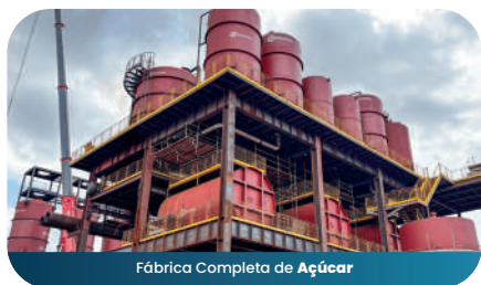
Fábrica Completa de Açúcar