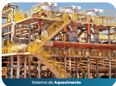
Sistema de Aquecimento