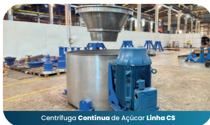
Centrífuga Contínua de Açúcar Linha CS