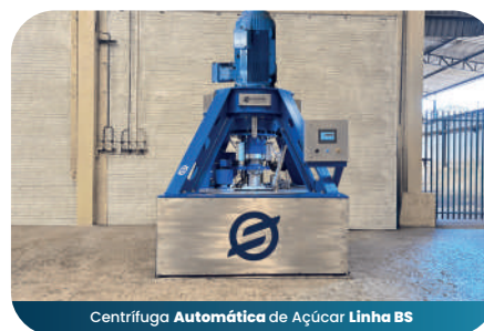
Centrífuga Automática de Açúcar Linha BS