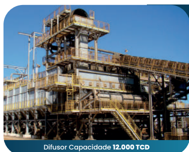
Difusor Capacidade 12.000 TCD