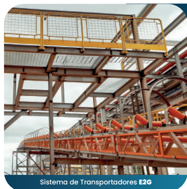
Sistema de Transportadores E2G