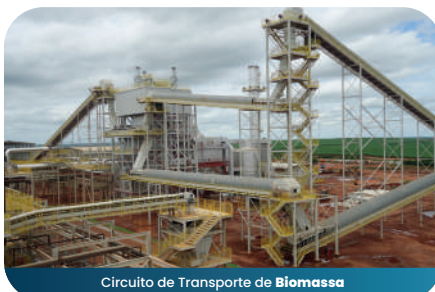
Círculo de Transporte de Biomassa