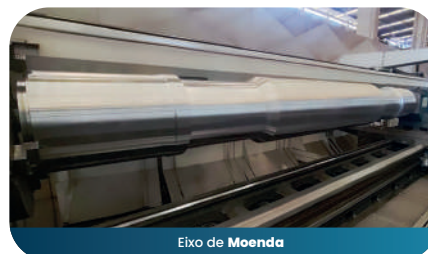
Eixo de Moenda