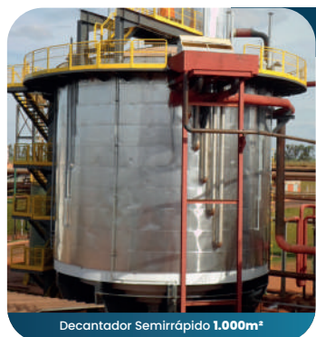
Decantador Semirrápido 1.000m³