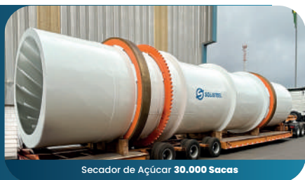
Secador de Açúcar 30.000 Sacas