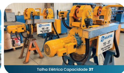
Talha Elétrica Capacidade 3T