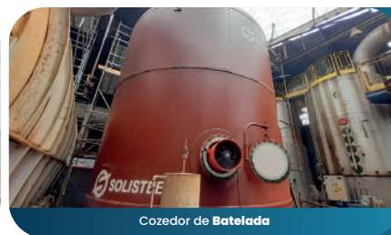
Cozedor de Batelada