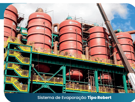
Sistema de Evaporação Tipo Robert