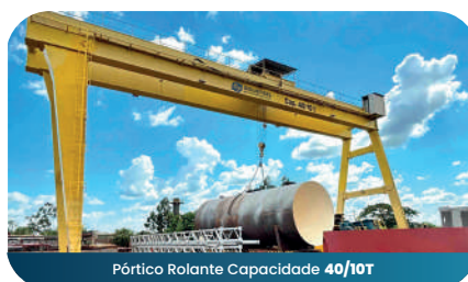
Pórtico Rolante Capacidade 40/10T