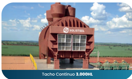
Tacho Contínuo 3.000HL