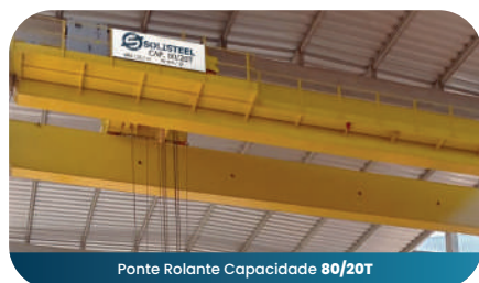
Ponte Rolante Capacidade 80/20T

Toda equipe técnica é composta por engenheiros, projetistas e desenhistas, que seguem todas as normas aplicadas a equipamentos de elevação e movimentação de carga, como: NBR 8400 , mas também podem atender as normas FEM 1001, CMAA 70, DIN 15.018-1, AISE , conforme necessidade dos nossos clientes.