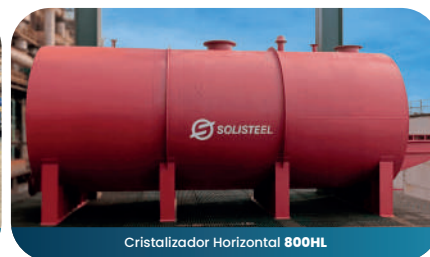
Cristalizador Horizontal 800HL